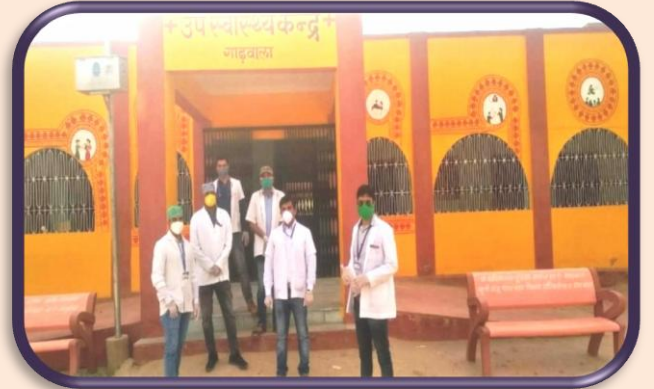
डॉ. एमएन होम्योपैथी महाविद्यालय, बीकानेर में कोविड-19 से बचाव हेतु जन-जागरुकता अभियान के लिए स्टॉफ द्वारा शपथ ग्रहण