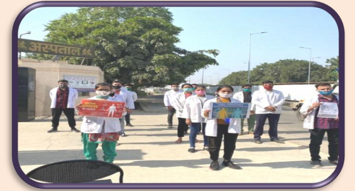
स्वास्थ्य कल्याण होम्योपैथी कॉलेज, जयपुर द्वारा दिनांक 06 नवम्बर 2020 को कोविड-19 से बचाव हेतु जन-जागरुकता रैली का आयोजन