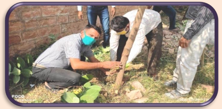
गोदग्राम झालामण्ड में विश्वविद्यालय संकाय सदस्यों द्वारा वृक्षारोपण कार्यक्रम का आयोजन