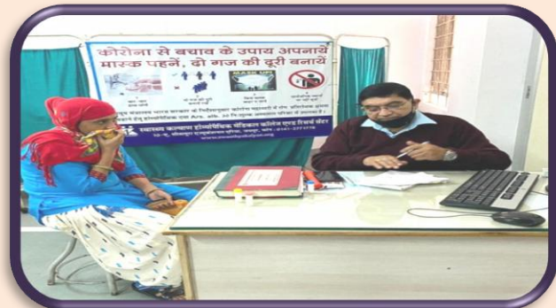
स्वास्थ्य कल्याण चिकित्सा महाविद्यालय, जयपुर में इम्यूनटी बूस्टर किट आर्सेनिक एल्बम-30 का वितरण