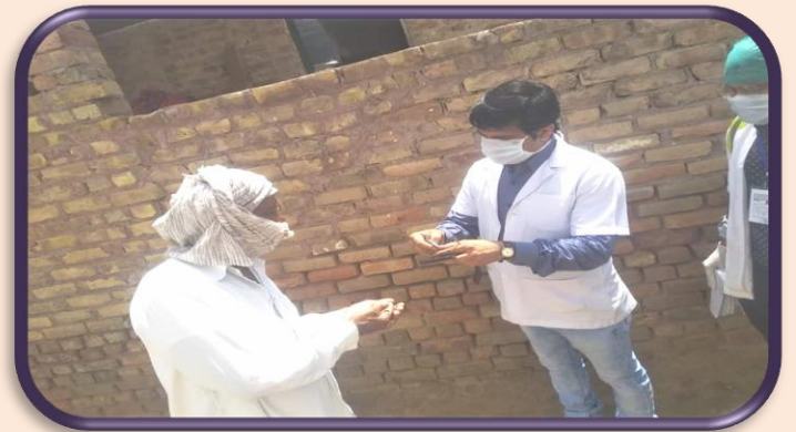
डॉ. एमएन होम्योपैथी महाविद्यालय, बीकानेर में कोविड-19 से बचाव हेतु इम्यूनटी बूस्टर किट आर्सेनिक एल्बम-30 का जन साधारण में वितरण