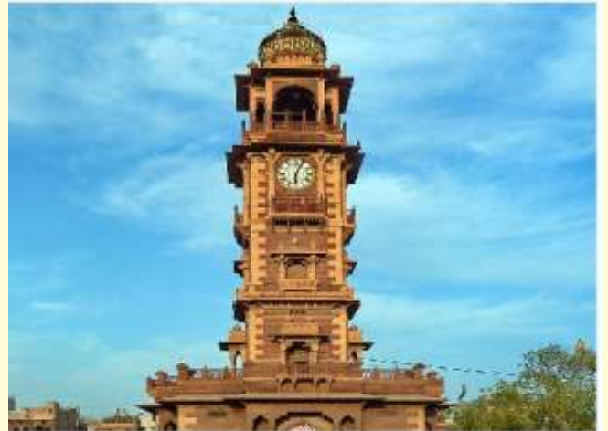
डॉ. सर्वपल्ली राधाकृष्णन् राजस्थान आयुर्वेद विश्वविद्यालय